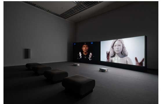
「国際芸術祭あいち 2022」 愛知芸術文化センター (愛知) での展示風景 2022