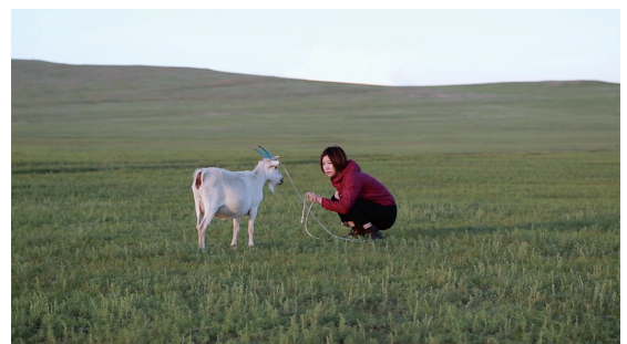
山羊を抱く / 貧しき文法 | 2016 シングルチャンネルビデオ | 13分 50秒