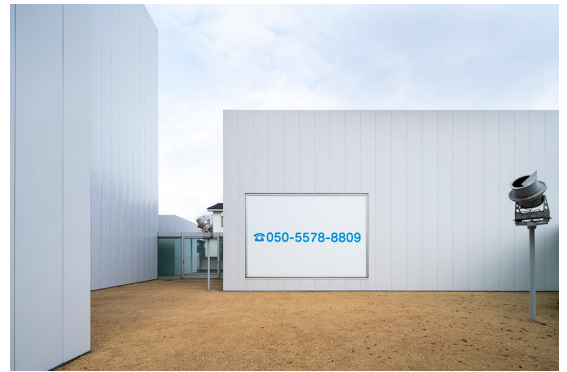
「百瀬文 口を寄せる」十和田市現代美術館 (青森) での展示風景 2022

愛知県美術館、大阪中之島美術館、東京国立近代美術館、東京都現代美術館、横浜美術館