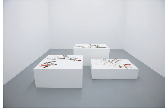
性能 | 2019 | 剪定鋏、枝、草 | サイズ可変

国立国際美術館、東京都現代美術館、東京国立近代美術館、 滋賀県立近代美術館、霧島アートの森、第一生命保険株式会社