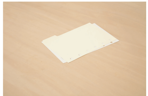
2枚 | 2019 | 紙、接着剤 | 8.9x12.7cm