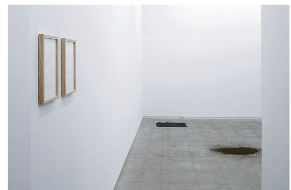
「事実」(2017) TALION GALLERY での展示風景