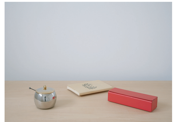
実存 | 2018 | 砂糖入れ、アクリル板 | 7.2x8.5x7.6cm 実存 | 2018 | 本、板 | 2x15.2x10.7cm 実存 | 2018 | 眼鏡ケース、板 | 4x16x5cm