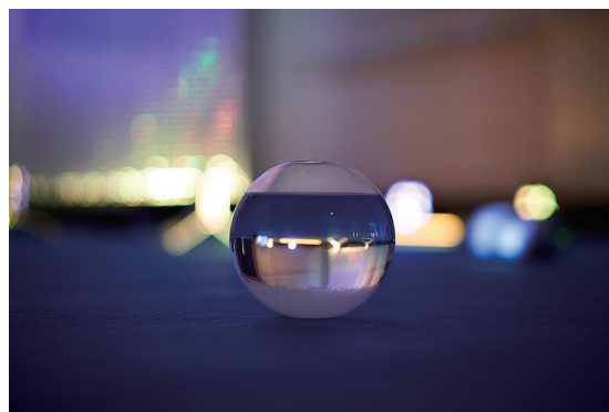
展示風景：「気候療法 | Climatotherapy」 サマセット・ハウス | 2018