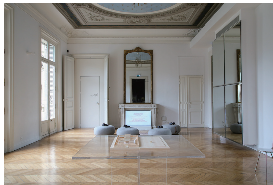
展示風景：「深みへ - 日本の美意識を求めて -」 ロスチャイルド館 | 2018 | 撮影：Yuu Takagi