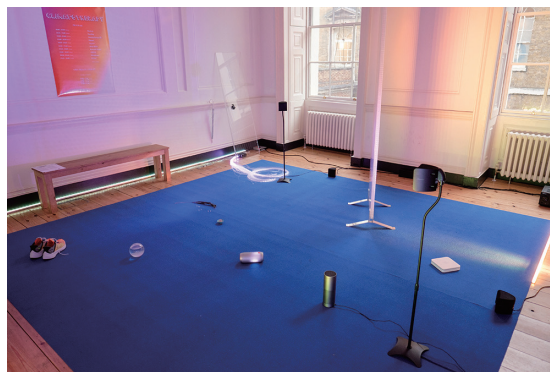
展示風景：「気候療法 | Climatotherapy」 サマセット・ハウス | 2018