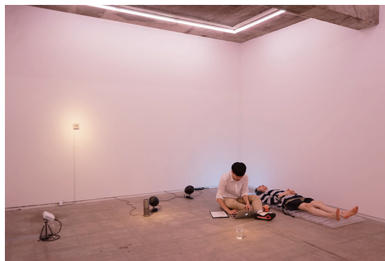
展示風景：「免疫療法 | Immunotherapy」 TALION GALLERY | 2019 | 撮影：稲田禎洋