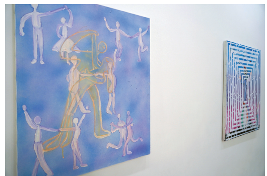
展示風景：「nursery」 People | 2019 | 撮影：大谷将弘