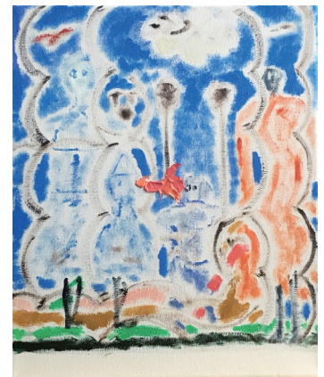
untitled | 2020 | キャンバスに油彩 | 29.4x21cm