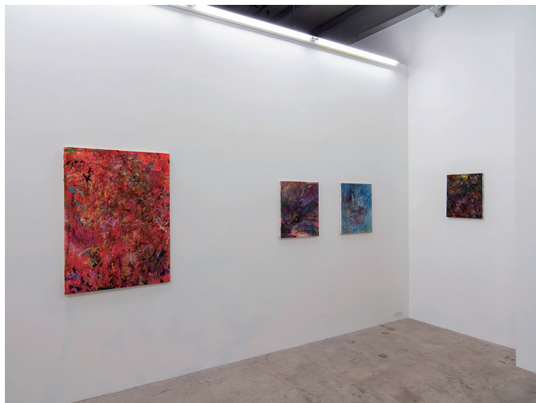
岩永忠すけ | 「summer show」 Satoko Oe Contemporary での展示風景 | 2016