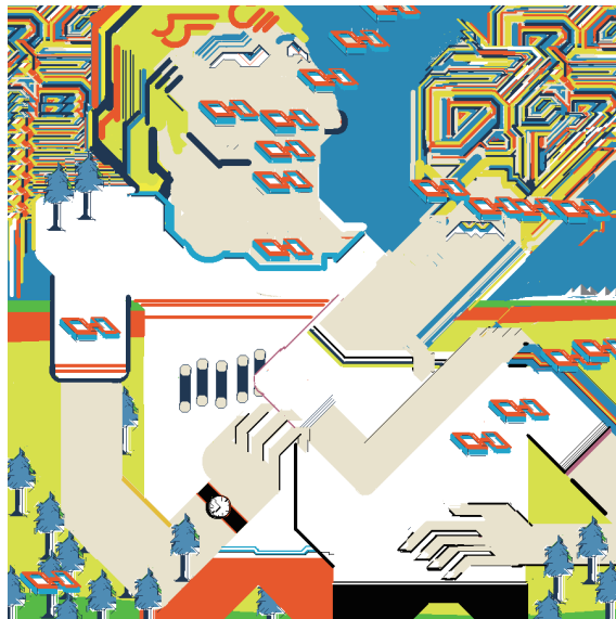
二艘木洋行 | 梨 | 2005 | お絵描き掲示板 | 900x900pixel

近年の主な展覧会に、「East Asia Culture City 2019《3^x = ∞ ound Town》」仁川アートプラットフォーム (2019/仁川、韓国)、「二艘木洋行さんと山本直輝さんの作品をgnck先生をお呼びして検証する展覧会」パーブルームギャラリー (2019/東京)、「新作展」TALION GALLERY (2018/東京)、「た・・ 勃て・!・ 勃つんだ英樹ー!」bar星男(2017/東京)、「大ポスター展」TALION GALLERY (2016/東京)、「ニセ・ザ・チョ イス」ビリケンギャラリー (2015/東京)、「パーブルーム大学II」熊本市立現代美術館 (2015/熊本)、「VOCA 現代美術の展望」上野の森美術館 (2014/東京)、「光るグラフィック」creation gallery 8 (2014/東京)、「プロミスフレンズニアレストネイバーランド前」TALION GALLERY (2014/東京)、「ii tenki」WILLEM BAARS PROJECTS (2013/アムステルダム)、「であ、しゅとるむ」名古屋市民ギャラリー矢田 (2013/愛知)、「MOBILIS IN MOBILI -交錯する現在-」コーポ北加賀屋 (2013/大阪)、「キュレーターからのメッセージ 2012 現代絵画のいま」兵庫県立美術館 (2012/兵庫)、「インターネット アート これから」NTTインターコミュニケーション・センター (2012/東京)など。