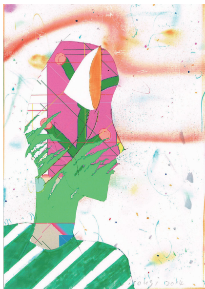
二艘木洋行 | 梨 | 2014 | ペン、カーボン紙、スプレー、インクジェットプリント、紙 | 21 x 14.8 cm